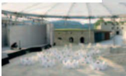
Events im Innenhof der Josefsburg