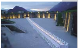
Festiviteiten in het binnenhof van de Josefsburg