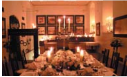
Chapelle du Château