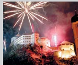
Saint-Sylvestre à Kufstein