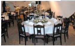
Salle voûtée des Bombardiers