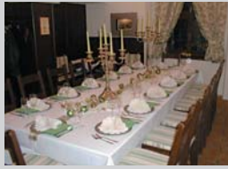
« Stube » (Petite salle)