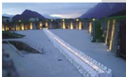
Események a Josefsburg belső udvarában